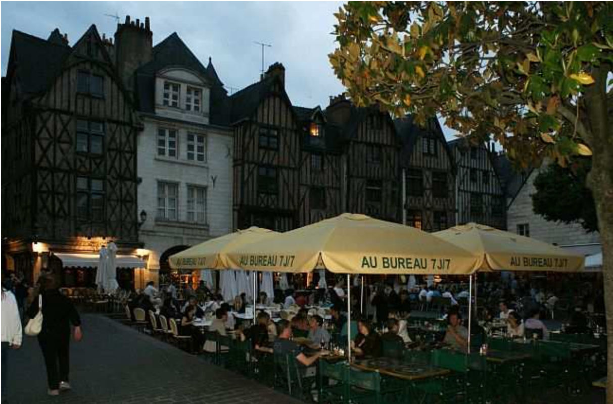
Tours - Plumereau