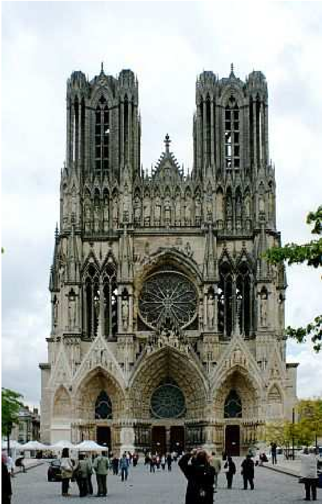
Reims - Kathedrale.