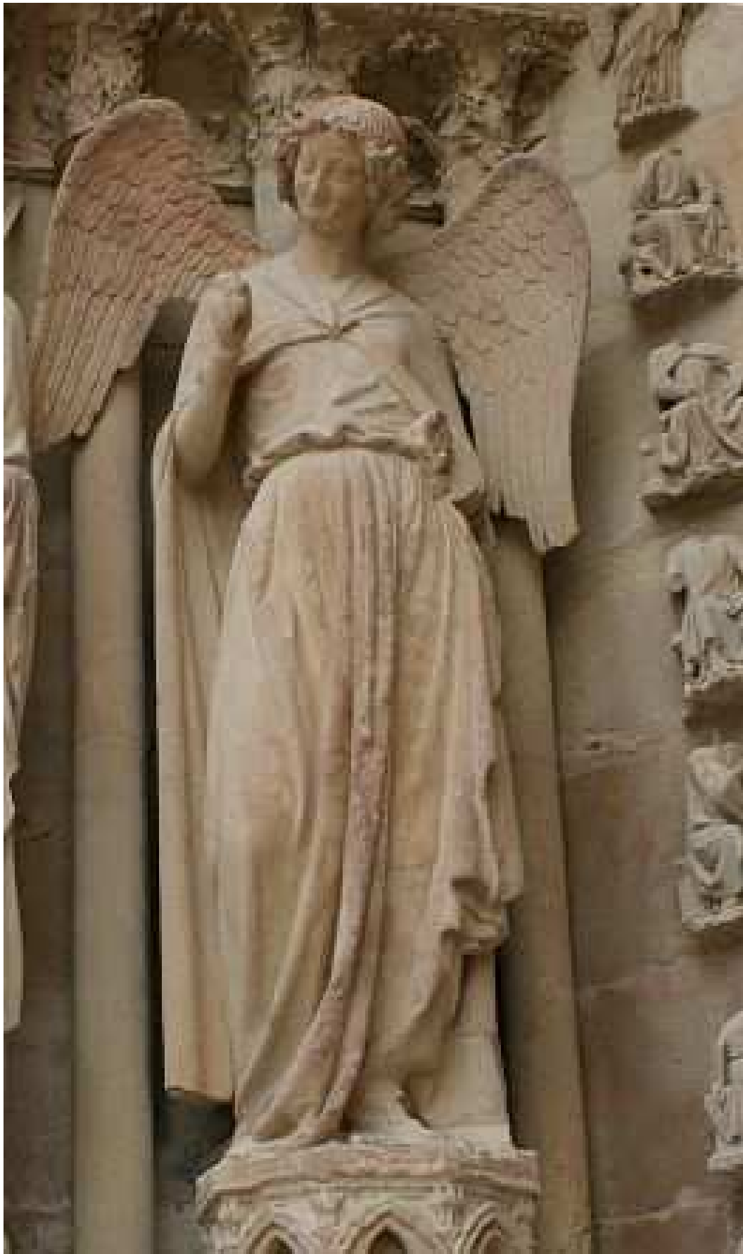
Reims - Engel