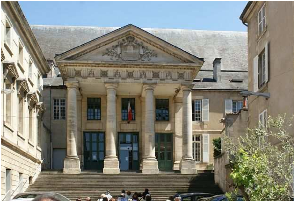
Poitiers - Justizpalast