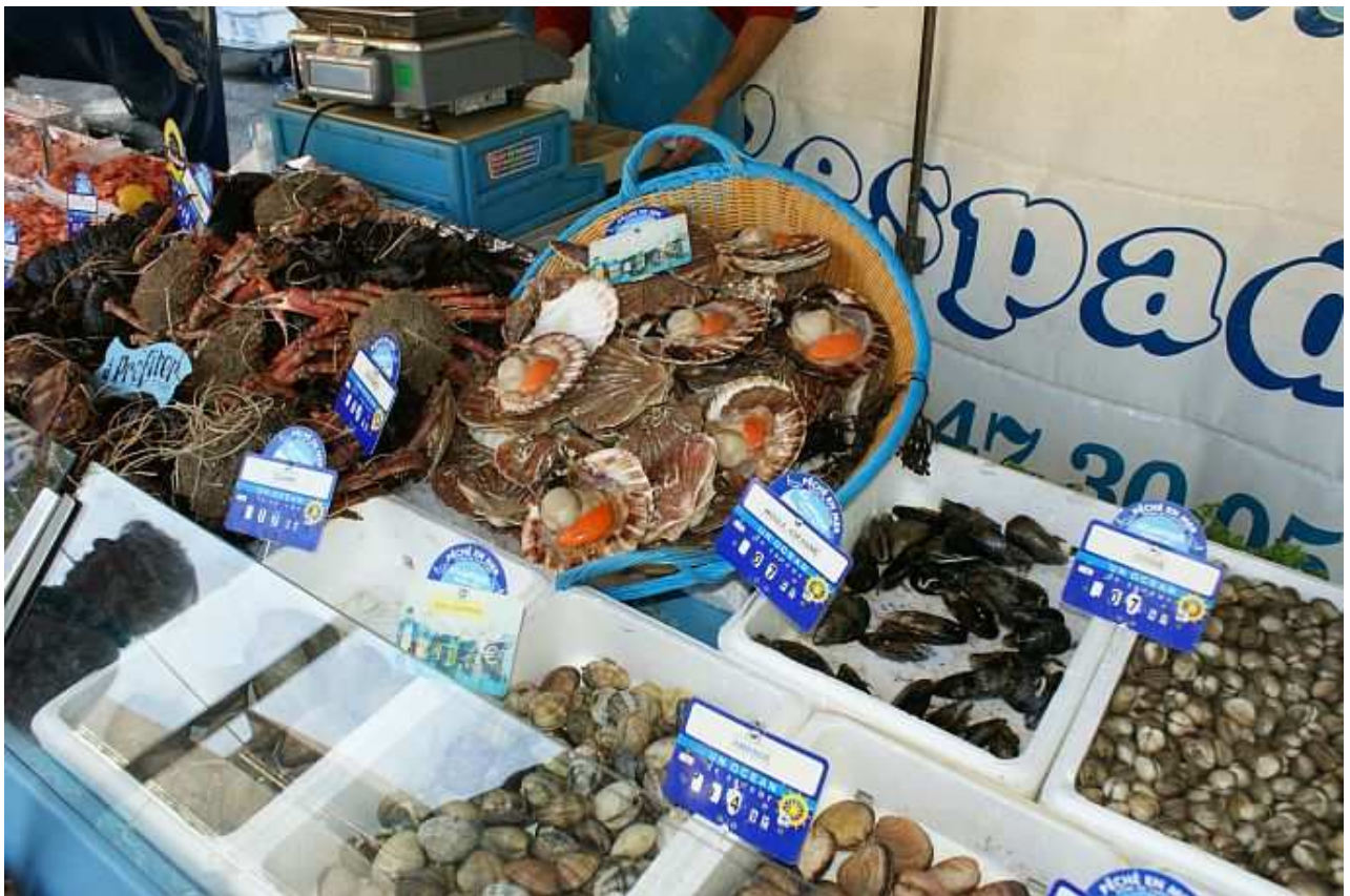
Markt in Ambois