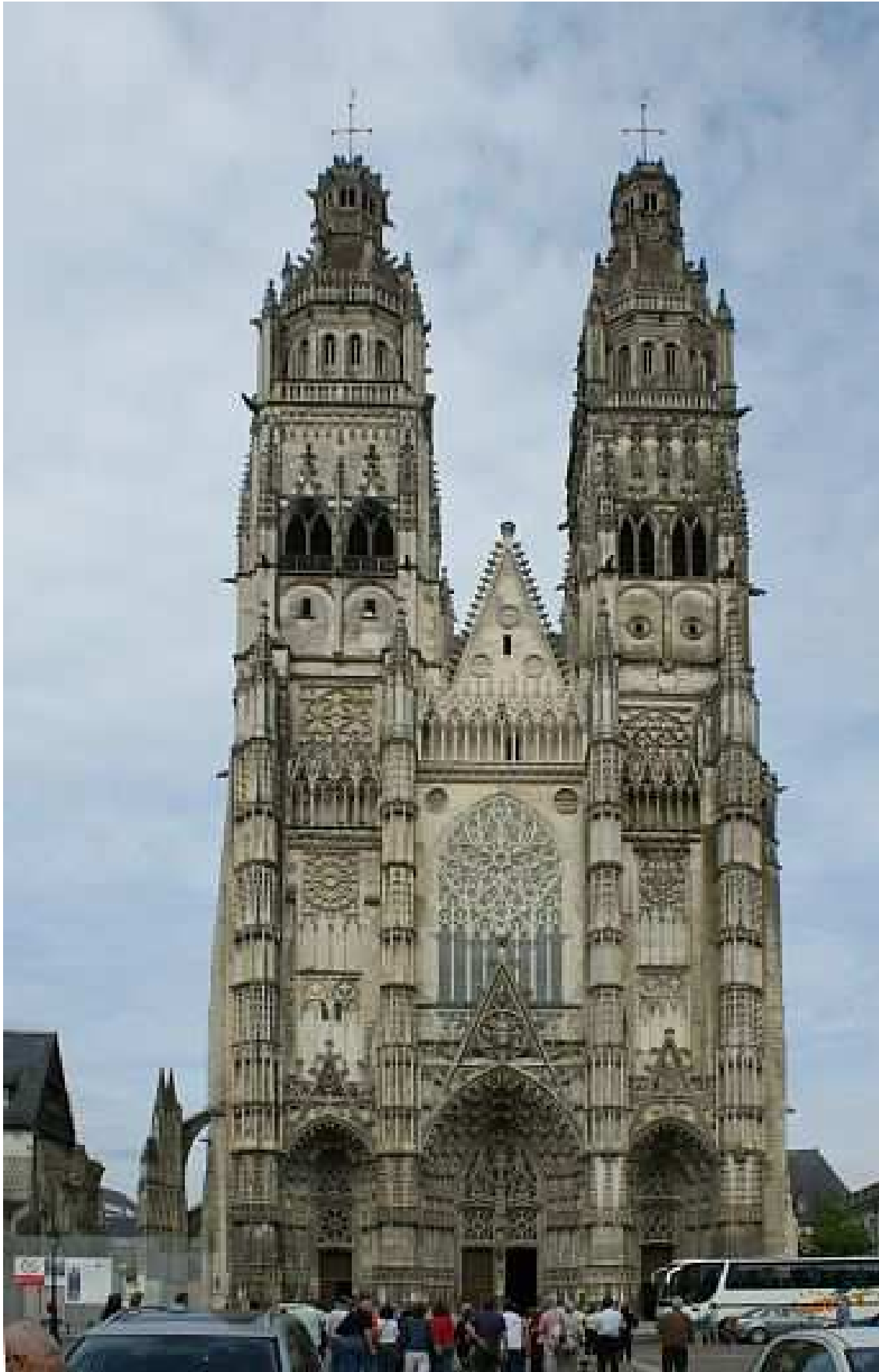
Tour - St Gatiens