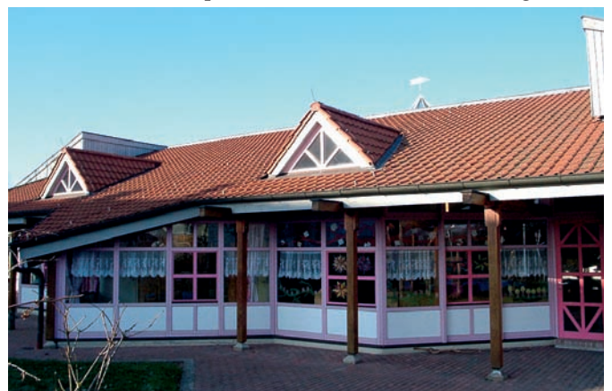
Kindergarten am Bremig wird erweitert

Bestärkt wurde unsere Haltung zu diesem Zeitpunkt auch durch den Zuzug vieler