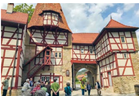
Fahrradtour nach Iphofen mit Stadtführung