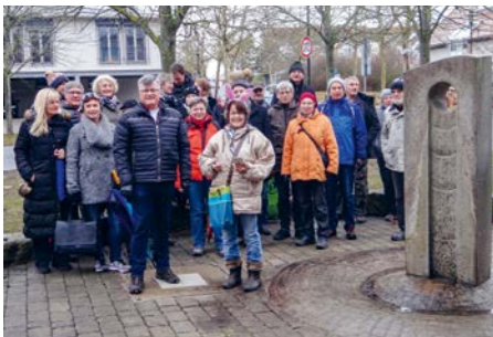
Winterwanderung nach Gerbrunn