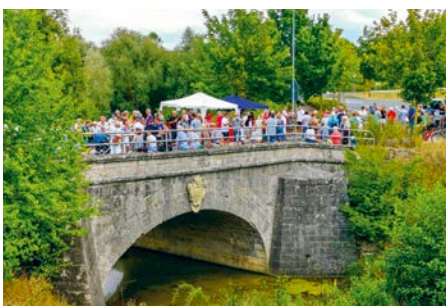
1. Rottendorfer Brückenschoppen