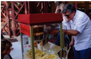
Kinonacht mit Popcorn for free