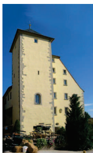
... nach Bibergau