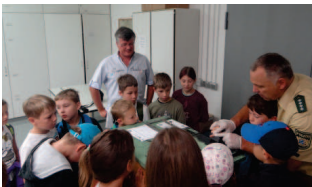
Nochmal Ferienprogramm: Besuch bei der Bereitschaftspolizei in Würzburg