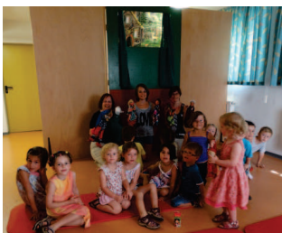
Ferienprogramm der AsF: Kasperletheater