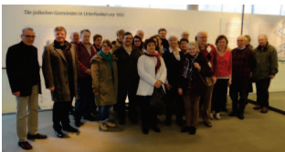
Führung durch Shalom Europa