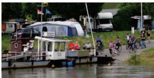
Radtour nach Nordheim