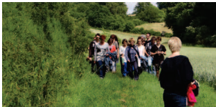
Natur- und Kräuterwanderung